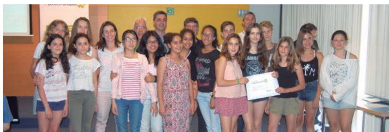
Alumnes i companys col·legiats guardonats