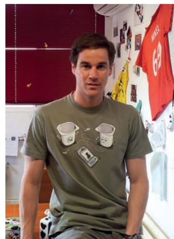
Més informació a la secció d'Educació "Referents" del Docusport-La Revista núm. 30

En conjunt, la idea que batega darrera d'aquesta proposta, és que no hi ha aprenentatge útil si no fa més bones persones i, com s'indicava la tardor de l'any passat des d'aquestes mateixes pàgines, per aconseguir-ho, els professors d'Educació Física tenim, entre d'altres, la nostra matèria, l'assignatura de la felicitat. ■